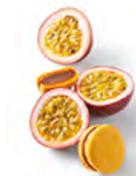
MARACUJA 熱情果黑朱古力 熱情果純黑朱古力蓉