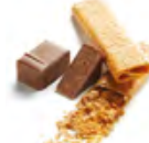
GRAIN DENTELLE 登堤爾