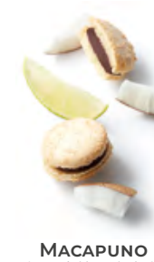
MACAPUNO 椰子青檸黑朱古力