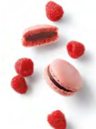
SALVADOR 紅桑子黑朱古力 紅桑子朱古力蓉