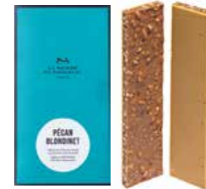
PÉCAN BLONDINET ペカン ブロンディネ

— ブロンドのピーカン — 細かく砕いたピーカンナッツ入りミルクチョコレートに ドゥルセチョコレートを重ねた2層仕立て。