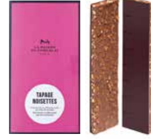
TAPAGE NOISETTES タパージュ ノワゼット

— はしゃぐヘーゼルナッツ — 細かく砕いたヘーゼルナッツ入りのミルクチョコレートに ダークチョコレートを重ねた2層仕立て。