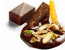
PRALINÉ MENDIANT プラリネ マンディアン

キャラメリゼしたアーモンドや ローストしたヘーゼルナッツとピスタチオ、 オレンジコンフィ入りのアーモンドプラリネ