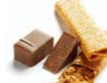
GRAIN DENTELLE グレン ダンテル