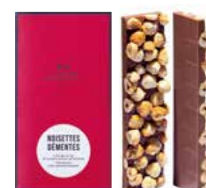
NOISETTES DÉMENTES ノワゼット デマント

— 途方もないヘーゼルナッツ — キャラメリゼしたヘーゼルナッツをトッピングした ミルクチョコレート。