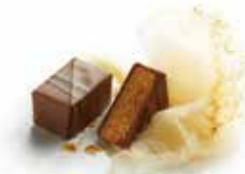
RIGOLETTO LAIT リゴレットレ