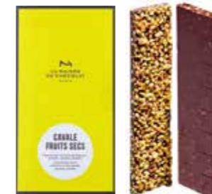
CAVALE FRUITS SECS キャヴァル フリュイ セック

— 逃げ遅れたナッツたち — アーモンド、ヘーゼルナッツ、ピスタチオを 細かく砕いてトッピングしたダークチョコレート。