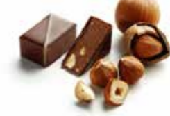
PRALINÉ NOISETTE ノワゼット

マルドン産の塩を利かせ 細かく砕いたヘーゼルナッツ入りの アーモンド&ヘーゼルナッツの ミルクプラリネ