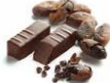
EXTRÊME CHOCOLAT エクストレーム ショコラ

ガーナ産カカオの力強く スパイシーな味わいが 特徴的なプレーンな ダークガナッシュ