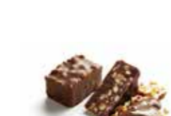
ROCHER NOIR ET LAIT ロシェ ノアール/ロシェレ