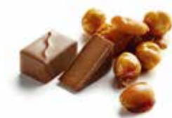
FIGARO LAIT フィガロレ

キャラメリゼしたアーモンドや ローストしたヘーゼルナッツとピスタチオ、 オレンジコンフィ入りのアーモンドプラリネ