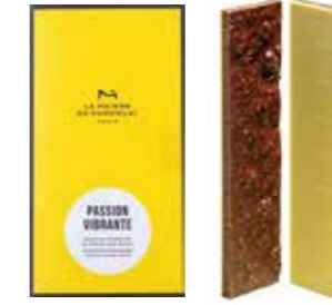
PASSION VIBRANTE パッション ヴィブラント

— 高ぶるパッション — クレープダンテル入りダークチョコレートに パッションフルーツ風味を重ねた2層仕立て。