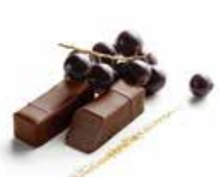
NOIR DE CASSIS カシスノアール