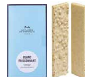
BLANC FRISSONNANT ブラン フリソナン